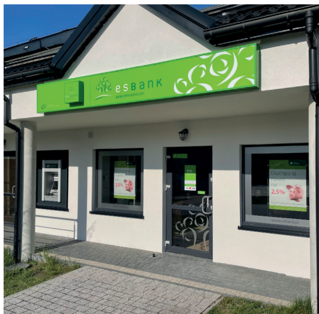
Filia nowego Oddziału Kleszczów w Sulmierzycach od 2 maja 2022 r. ma nową lokalizację przy pl. Gabriela Turckiego 8.

Jesteśmy dumni, że stanowimy bank pierwszego wyboru dla wielu lokalnych firm, głównie z sektora MŚP, dzięki czemu przyczyniamy się nie tylko do społecznego, ale i gospodarczego rozwoju lokalnych środowisk. Będąc teraz jeszcze bliżej, oferujemy Przedsiębiorcom pomoc indywidualnych, mobilnych Doradców Klienta Korporacyjnego oraz elastyczną i konkurencyjną ofertę. Dzięki niej możemy kompleksowo wspierać Państwa firmy zarówno w codziennym zarządzaniu finansami, jak i w inwestycjach i rozwoju. Aktualnie oferujemy obniżenie o 50% stawki prowizji przygotowawczej w ramach promocyjnych warunków dla kredytów na działalność gospodarczą oraz rolniczą, udzielonych na standardowych warunkach cenowych. Promocja trwa do 30 września 2022 roku. Zapraszamy do kontaktu z naszymi Oddziałami i Doradcami Klienta Korporacyjnego!