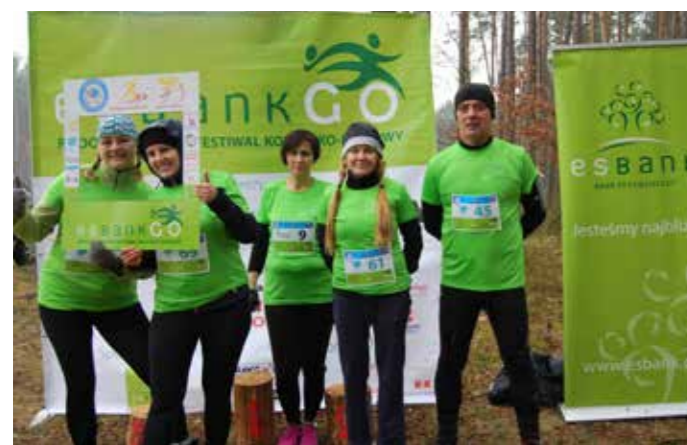
Zawodnicy Drużyny ESBANK Bank Spółdzielczy i Przyjaciele wystartowali w II Radomszczańskim Biegu Charytatywnym Szczęśliwa Siódemka i I Radomszczańskim Nordic Walking.

Radomszczańskiego Festiwalu Kolarsko-Biegowego, która odbyła się 13 kwietnia 2019 r. w Radomsku. Nie przeszkodziła kapryśna, kwietniowa pogoda.