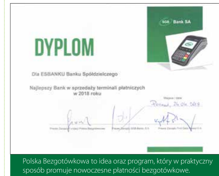
Polska Bezgotówkowa to idea oraz program, który w praktyczny sposób promuje nowoczesne płatności bezgotówkowe.

Bezgotówkowa, zaangażowany jest nasz Bank. W kwietniu 2019 r. ESBANK Bank Spółdzielczy otrzymał wyróżnienie dla Najlepszego sprzedawcy terminali płatniczych w 2018 r. w ramach SGB. Wyróżnienie to dla nas motywacją do dalszej aktywności w upowszechnianiu wygodnego i bezpiecznego obrotu bezgotówkowego na terenie naszego działania.