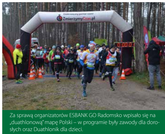
Za sprawą organizatorów ESBANK GO Radomsko wpisało się na „duathlonową” mapę Polski – w programie były zawody dla dorosłych oraz Duathlonik dla dzieci.

„ Nasz festiwal miał na celu nie tylko połączyć kolarzy, biegaczy i nordic walking, ale również pomoc osobom niepełnosprawnym i zwierzętom. Dzięki dobroczynności sportowców zebraliśmy ponad 1800 zł ” – podsumowuje reprezentujący organizatora imprezy, Kolarsko-Biegowy Klub Sportowy Radomsko,