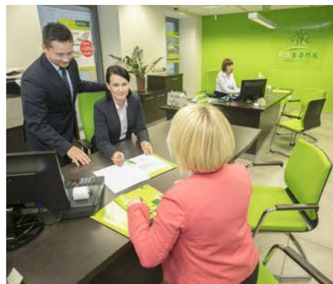
Wydłużone godziny pracy centralnej placówki ESBANKU Banku Spółdzielczego obowiązują od 1 kwietnia 2019 r.

Od godz. 8:00 do godz. 18:00. To nowe, wydłużone godziny pracy naszej placówki w Centrali. Zmiana stanowi element reorganizacji sieci placówek na terenie Radomska, gdzie aktualnie zapraszamy Klientów do 4 lokalizacji. To największa sieć własnych