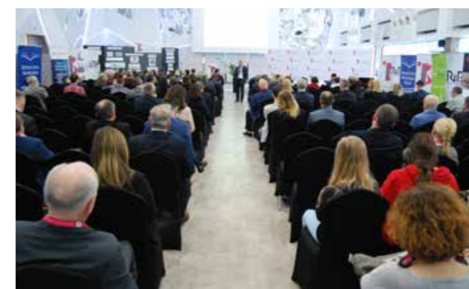
ESBANK Bank Spółdzielczy był Partnerem Głównym III Radomszczańkiego Forum Przedsiębiorczości

20 marca – spotkanie z młodzieżą zainteresowaną poznaniem lokalnego rynku pracy oraz specyfiki instytucji bankowej w ramach programu edukacyjnego „Dzień Przedsiębiorczości”. Tydzień później – wsparcie Konkursu „Bądź Przedsiębiorczy – wypromuj zawód”, który przybliży młodzieży branżę, do jakich przygotowuje Zespół Szkół Ekonomicznych w Radomsku, w tym ekonomię i bankowość. Te cykliczne inicjaty-