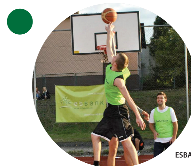
ESBANK Streetballmania 2012