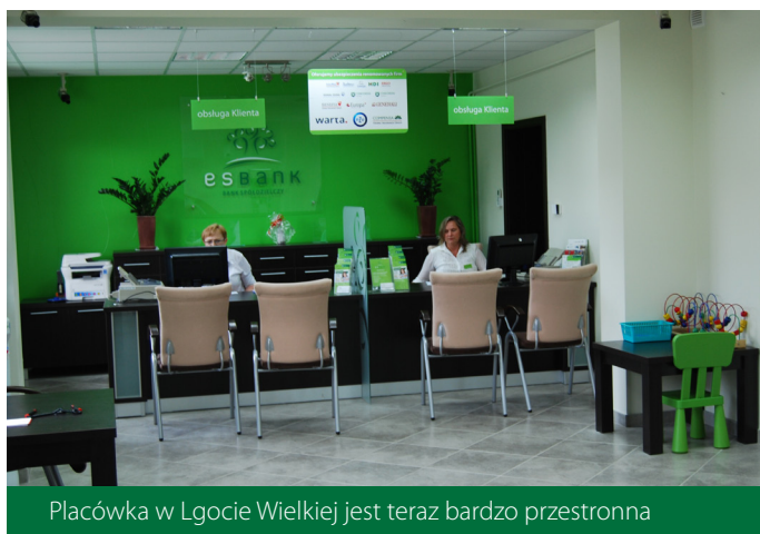
Placówka w Lgocie Wielkiej jest teraz bardzo przestronna

Filia ESBANKU znajdująca się w Lgocie Wielkiej zyskała nowoczesny i komfortowy wygląd. Remont placówki odbył się na przełomie kwietnia i maja.