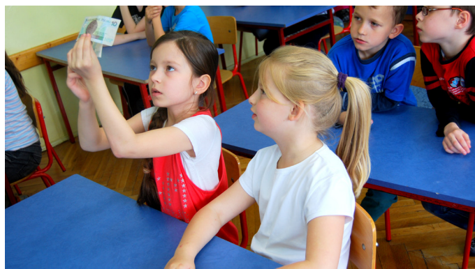
Uczniowie podczas spotkań poznawali zabezpieczenia nowych banknotów

Młodsze dzieci poznały historię pieniądza oraz nominały monet i banknotów, starsze natomiast sprawdziły swoją