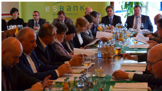
Podczas Zebrania Przedstawicieli m.in. podsumowano rok 2013

Fundusze własne ESBANKU na koniec 2013 roku osiągnęły