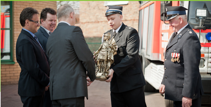
W podziękowaniu za wsparcie od OSP Dmenin otrzymaliśmy figurkę św. Floriana.

Zakupiony przez strażaków wóz posiada zbiornik wodny o pojemności 2.000 litrów, autopompę zespoloną z samochodem, 11-metrową drabinę i agregat prądowórczy. Komfort jazdy i wyposażenie auta z pewnością przyczynią się do poprawy bezpieczeństwa na terenie gminy Kodrąb.