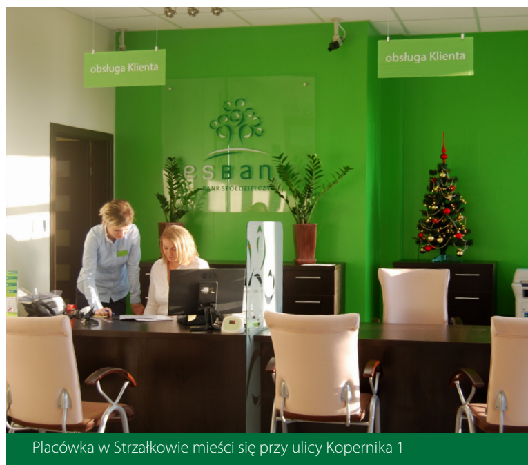
Placówka w Strzałkowie mieści się przy ulicy Kopernika 1

Punkt Obsługi Klienta w Strzałkowie to już 32 placówka ESBANKU Banku Spółdzielczego. Zapraszamy!