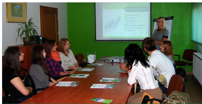
Uczniowie Elektryka na lekcji w ESBANKU

się 24 października, natomiast miesiąc później – 22 listopada – podobną lekcję w ramach Tygodnia Przedsiębiorczości