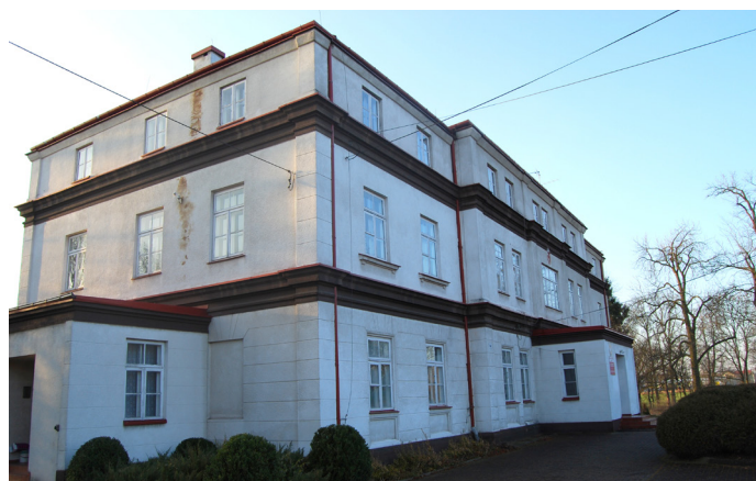
Tak obecnie wygląda dworek wybudowany przez H. Siemiradzkiego