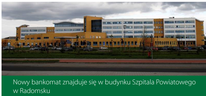
Nowy bankomat znajduje się w budynku Szpitala Powiatowego w Radomsku

tów. W całej Polsce nasi Klienci mogą natomiast korzystać z ponad 4 000 bezprowilnych bankomatów, należących do banków zrzeszonych w Spółdzielczej Grupie Bankowej oraz Banku Polskiej Spółdzielczości, a także z bankomatów Krakowskiego Banku Spółdzielczego.