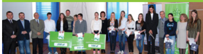
Laureaci konkursu „Nie zubożnij się na chemię”

przedszkole zaprezentowało także swój okrzyk lub krótką prezentację muzyczno-ruchową.