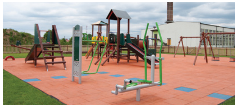
Nowoczesny plac zabaw w Kamieńsku

A co jeszcze może zainteresować naszych czytelników podczas odwiedzin gminy Kamieńsk?