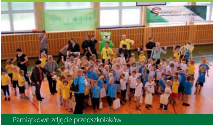
Pamiątkowe zdjęcie przedszkolaków

W październiku RAP wspólnie z naszym bankiem zorganizował turniej piłki nożnej przedszkolaków – „ESBANK z RAPEM z przedszkolakiem”. Wzięło w nim udział osiemdziesiąt dzieciaków z ośmiu radomszczańskich przedszkoli. Mali piłkarze z zapałem kopali piłkę i zdobywali kolejne gole. Zwycięzcą turnieju została Publiczne Przedszkole nr 10, ale nagrody trafiły do wszystkich grających dzieciaków – bo najważniejszy był sam udział. Młodym piłkarzom życzymy kolejnych sukcesów!