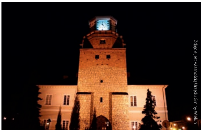
Wieluński ratusz z Bramą Krakowską