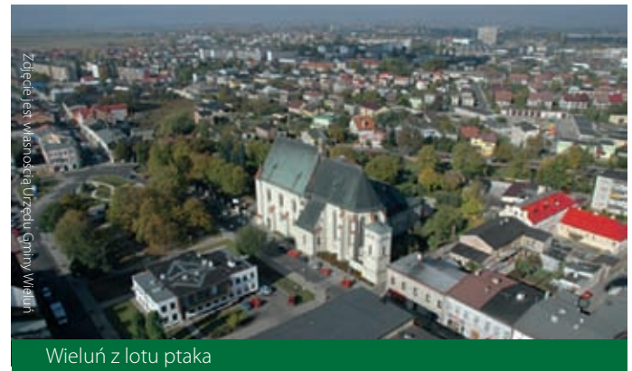
Wieluń z lotu ptaka

Wieluń jest jednym z 25 miast otoczonych za czasów Kazimierza Wielkiego murami obronnymi. Miały one długość 1300 m i obejmowały teren starego miasta o powierzchni 12 ha. Do czasów dzisiejszych zachowała się Brama Krakowska, która obecnie służy jako wieża ratuszowa. Pozostałości po murach można także podziwiać w innych częściach miasta. – Goście odwiedzający nasze miasto mówią, że staje się ono coraz piękniejsze, a szczególną uwagę zwracają nasze plandy, jedne z najpiękniejszych w Polsce. Potwierdzeniem tego jest fakt, że w ubiegłym roku od Towarzystwa Urbanistów Polskich nasze miasto otrzymało Grand Prix za realizację projektu