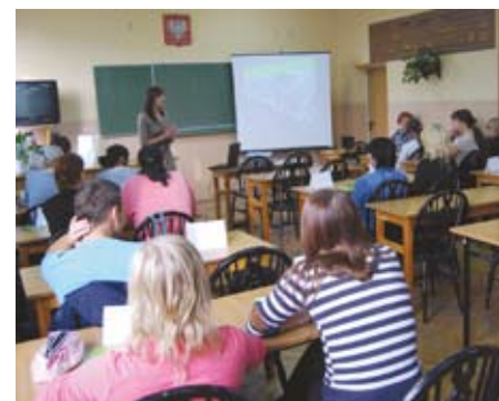
Uczniowie Drzewniaka dowiedzieli się m.in. jaka jest różnica pomiędzy lokatą a rachunkiem oszczędnościowym

Kolejne spotkanie, na temat Public Relations w firmie, odbyło się 16 listopada w II Liceum Ogólnokształcącym, w ramach „Światowego Tygodnia Przedsiębiorczości”. Uczniowie klasy III d poznali na nim podstawowe cele Public Relations oraz narzędzia, jakie wykorzystuje ESBANK do kreowania pozytywnego wizerunku.