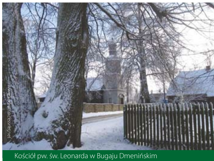
Kościół pw. św. Leonarda w Bugaju Dmenińskim