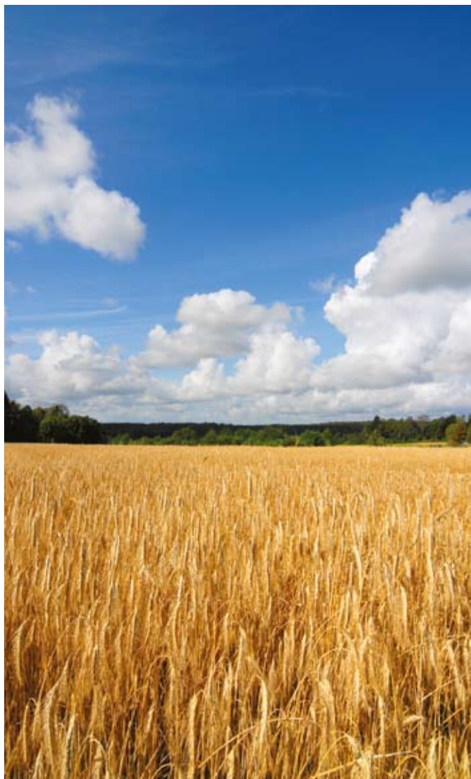
Ubezpieczenie upraw, podobnie jak zwierząt gospodarskich, współfinansowane jest z budżetu państwa

Wysokość opłaty obowiązującej w każdym roku kalendarzowym, stanowi równowartość w złotych 2 Euro od 1 ha, ustaloną przy zastosowaniu kursu średniego ogłaszanego przez Narodowy Bank Polski. Opłata ta będzie wnoszona na rzecz gminy właściwej ze względu na miejsce zamieszkania albo siedzibę rolnika. Dodatkowo rolnicy, którzy nie spełniają wymogów ustawy