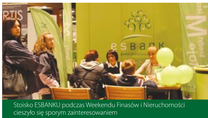
Stoisko ESBANKU podczas Weekendu Finansów i Nieruchomości cieszyło się sporym zainteresowaniem

częstochowskim rynku banki, firmy deweloperskie oraz pośrednicy nieruchomości. Swoje stoisko miał na tej imprezie również ESBANK Bank Spółdzielczy.