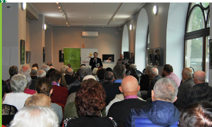
Słownik przygotowało 46 autorów. Promocja książki odbyła się 8 października 2017 r. w radomszczańskim Muzeum.