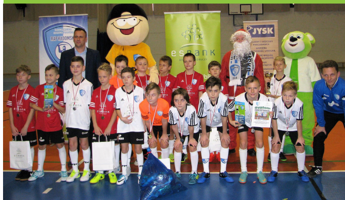
ESBANK RAP Radomsko rocznik 2007, który wygrał w swojej kategorii wiekowej, w 2017 r. zdobył też tytuł halowego Mistrza Województwa Łódzkiego i Puchar Marszałka.

Mikołajki na piłkarskim boisku to coroczna oferta wspieranej przez ESBANK Bank Spółdzielczy od 2010 roku Radomszczańskiej Akademii Piłkarskiej.