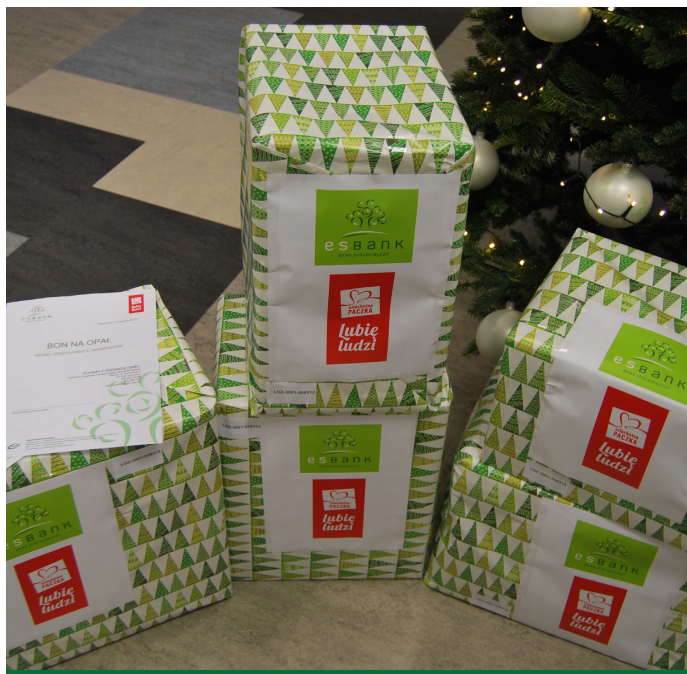
Szlachetna Paczka od Pracowników Banku zawierała m.in. żywność, artykuły chemiczne, a także bony na opał oraz sprzęt AGD.