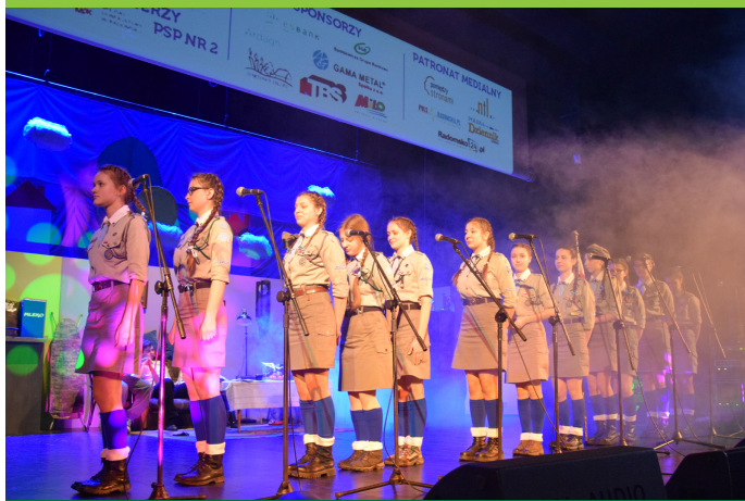
Finał „OPALU 2017” odbył się 10 grudnia 2017 r. w MDK w Radomsku.

„OPAL” to ogólnopolska impreza, która od ponad 30 lat aktywizuje, integruje i wszechstronnie rozwija młodzież skupioną w Związku Harcerstwa Polskiego. W atmosferze zabawy każdego roku promuje pozytywne wartości, z jakimi wiąże się idea skautingu, pozwala też w praktyce realizować ideę współdziałania oraz budować społeczne więzi – co jest bliskie etosowi polskich Banków Spółdzielczych. Kolejny rok z rzędu imprezę wspólnie z ESBANKIEM Bankiem Spółdzielczym wspierała Spółdzielcza Grupa Bankowa.